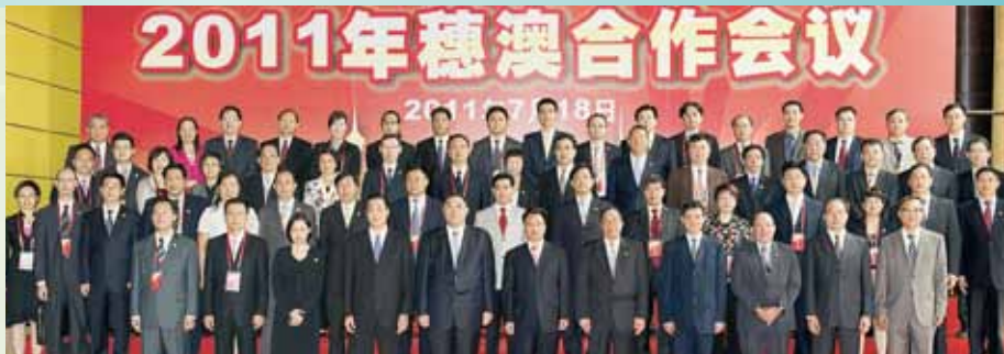
粤澳双方领导合照

此外，继早前签署《关于穗澳共同推进南沙实施CEPA先行先试综合示范区合作协议》外，于穗澳合作会议举行期间，经济局与广州市经济贸易委员会共同签订了《广州澳门加强会展业合作协议》；透过双方会展主管部门的紧密合作，协调和整合穗澳会展业资源的发展和共融，推动两地会展业的合作事项。根据合作协议内容，穗澳双方设立会展业合作协调小组，各自指派联络员建立固定沟通机制；借着会展信息共享、相互支持对方办展和共同推广宣传活动，致力提升“穗澳会展”品牌的国际影响力。同时，双方将致力完善两地会展协会组织战略联盟，联合申办国际知名展会及合作举办展会；此举措有利促进两地行业协会优势互补、寻找合适的合作伙伴拓展商机。