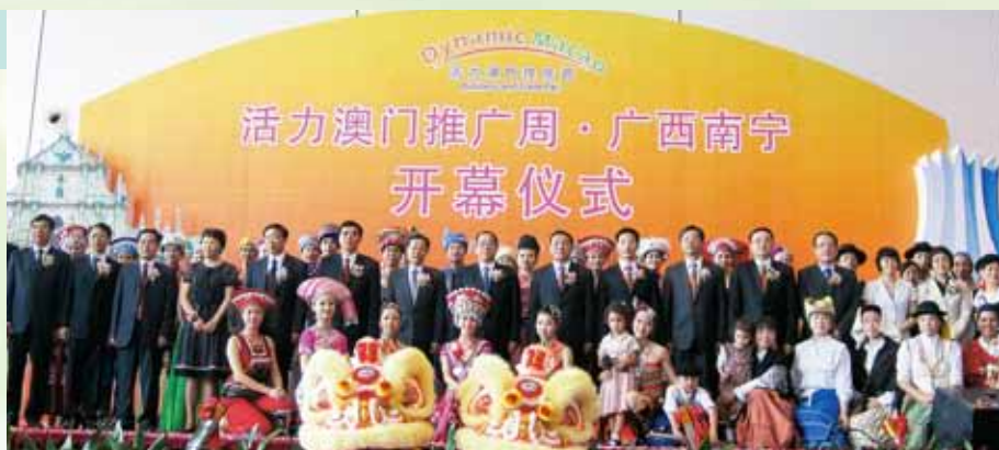
各主礼嘉宾出席开幕仪式

是次推广周活动的展览部分在南宁国际会展中心举行,展会面积超过8,100平方米、展位多达300个。展览场地分为主题展、商品展两个展区;澳门60多家知名商号展示了特色手信、澳门制造产品,以及红酒、咖啡、鱼类罐头等葡语国家著名产品,现场销售反应热烈。同时,主题展区展示了有关澳门经济发展、旅游文化、贸易投资、中国-葡语国家经贸合作论坛(澳门)等内容。为配合推广周的展销活动,特加设南宁澳门街分会场启动、澳门纪念封发行仪式、桂澳商贸对接洽谈会、葡语国家投资营商环境推介会、澳门商务旅游推介会等项目,以促进桂澳两地在经济、贸易、旅游等领域的合作和交流。