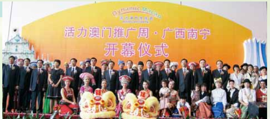
各主禮嘉賓出席開幕儀式

是次推廣週活動的展覽部分在南寧國際會展中心舉行，展會面積超過8,100平方米、展位多達300個。展覽場地分為主題展、商品展兩個展區；澳門60多家知名商號展示了特色手信、澳門製造產品，以及紅酒、咖啡、魚類罐頭等葡語國家著名產品，現場銷售反應熱烈。同時，主題展區展示了有關澳門經濟發展、旅遊文化、貿易投資、中國-葡語國家經貿合作論壇(澳門)等內容。為配合推廣週的展銷活動，特加設南寧澳門街分會場啟動、澳門紀念封發行儀式、桂澳商貿對接洽談會、葡語國家投資營商環境推介會、澳門商務旅遊推介會等項目，以促進桂澳兩地在經濟、貿易、旅遊等領域的合作和交流。