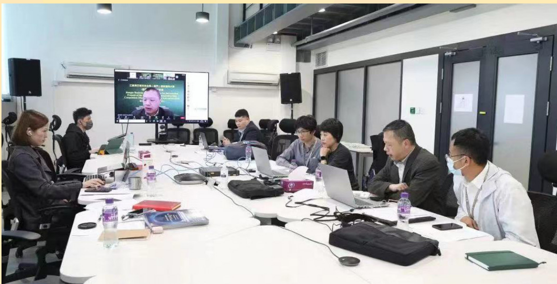
經科局舉辦巴葡大賽得獎項目與江蘇企業對接會