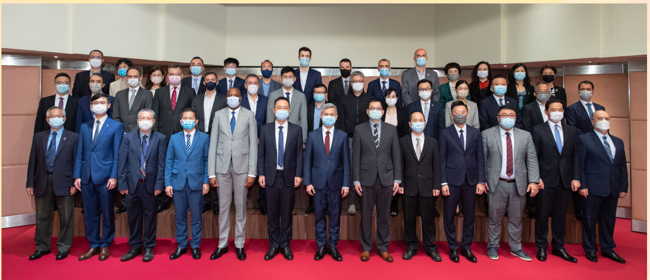
經濟及科技發展局舉辦“中葡科技交流合作”研討會

研討會的重要亮點，是邀請了巴西及葡萄牙孵化機構及科創企業以視頻分享發言，共同探討有效落實中葡科技交流合作的方式及配套政策措施。此外，現場來賓包括澳門