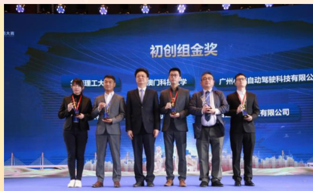
澳門科技大學項目獲得發明初創組金獎

經共同篩選和評審，澳門特區7個項目列入分組百強名單，取得複賽資格，其中4個項目闖入分組五十強，進入決賽，最後獲得一項金獎二項優秀獎的佳績。澳門科技大學“一種新型內源性緩釋硫化氫供體的研究”項目獲得發明初創組金獎，澳門大學“幹細胞球軟膏治療糖尿病足”項目和安信通科技（澳門）有限公司“智能車載機器人”項目分別獲得發明初創組優秀獎，獲獎成績是歷年之冠。