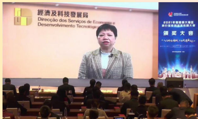
澳門特別行政區政府經濟及科技發展局陳子慧代局長在頒獎大會作線上致辭