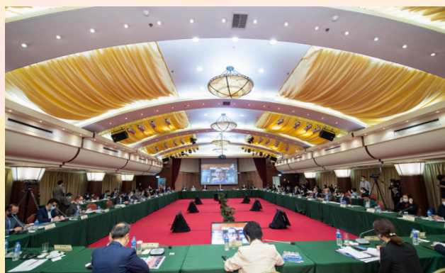
研討會現場氣氛熱烈

本次研討會現場氣氛熱烈，參會者均表示透過研討會的互相交流，可更深入認識中葡科技交流合作的內涵，及未來澳門在科技發展的方向及機遇。