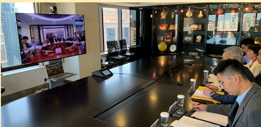
經科局與廣州市科技局進行線上會議