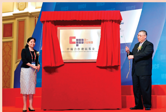
O Chefe do Executivo presidiu à cerimónia de descerramento da placa Fundo de Cooperação

A cerimónia de descerramento da placa alusiva do Fundo de Cooperação para o Desenvolvimento China-Países de Língua Portuguesa (Sociedade Limitada) teve lugar a 1 de Junho de 2017, no decurso da realização do 8.º Fórum Internacional sobre o Investimento e Construção de Infra-estruturas, marcando a instalação oficial do referido Fundo na RAEM, dando grande apoio para construir Macau numa Plataforma de Serviços para a Cooperação Comercial entre a China e os Países de Língua Portuguesa. Logo após a cerimónia de descerramento da placa, procedeu-se à cerimónia de assinatura de protocolos na qual o Fundo de Cooperação celebrou