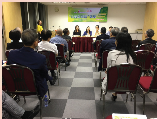
Numa sessão de esclarecimento da Lei de Rotulagem do Produtos Alimentares

informação dos géneros alimentícios, sejam pré-emballados ou não, no sentido de defender os interesses e o direito à informação dos consumidores. Os participantes reconhecem que as sessões de esclarecimento ajudam aprofundar os seus conhecimentos sobre a Lei de Rotulagem do Produtos Alimentares, reforçando a sua consciência do cumprimento da lei.