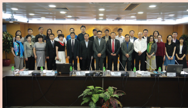
Representantes das duas partes

mútuo entre a Região do Pan-Delta do Rio das Pérolas.