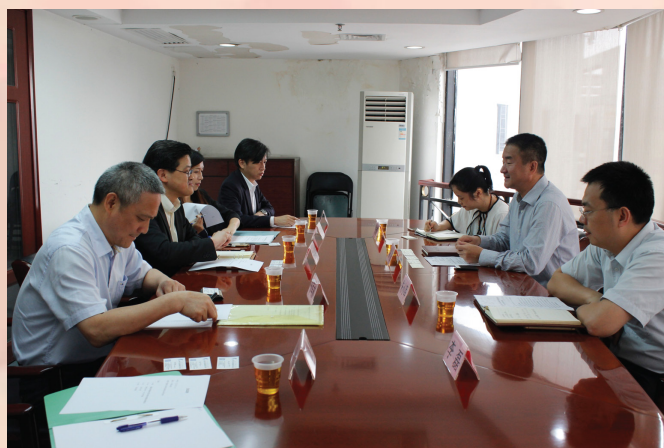
reunião de trabalho entre os delegados dos dois lados

Para melhor acompanhar os trabalhos de Grupo Especializado Guangdong-Macau para a Promoção Conjunta da Criação da Zona Piloto de Comércio Livre de Guangdong, reforçando a comunicação das duas partes, os membros da parte de Macau deslocaram-se, no dia 26 de Maio do corrente ano, a Guangzhou para reunir-se com o Gabinete dos Trabalhos da Zona Piloto de Comércio Livre da China (Guangdong), trocando opiniões sobre as novas medidas, políticas e outros temas de interesse comum respeitantes à Zona Piloto de Comércio Livre de Guangdong.