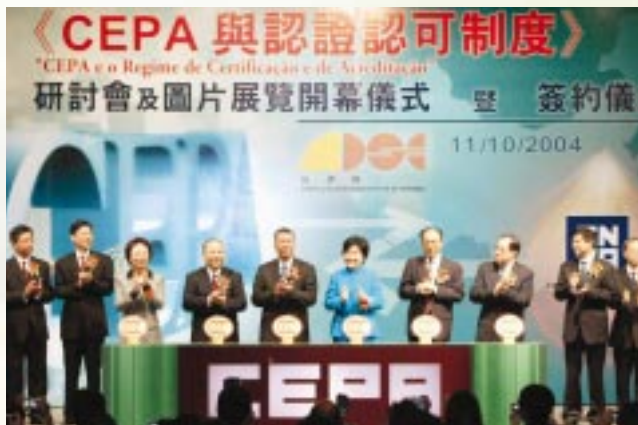
行政長官何厚鏞及國家認監會主任王鳳清等官員主持活動開幕儀式

由經濟局及國家認證認可監督管理委員會合辦的「CEPA認證認可制度研討會暨圖片展覽」於10月11日在旅遊塔會展娛樂中心開幕。開幕儀式邀請了行政長官何厚鏞、國家認證認可監督管理委員會主任王鳳清以及內地與澳門相關的官員為主禮嘉賓，本澳工商界人士亦踴躍出席。