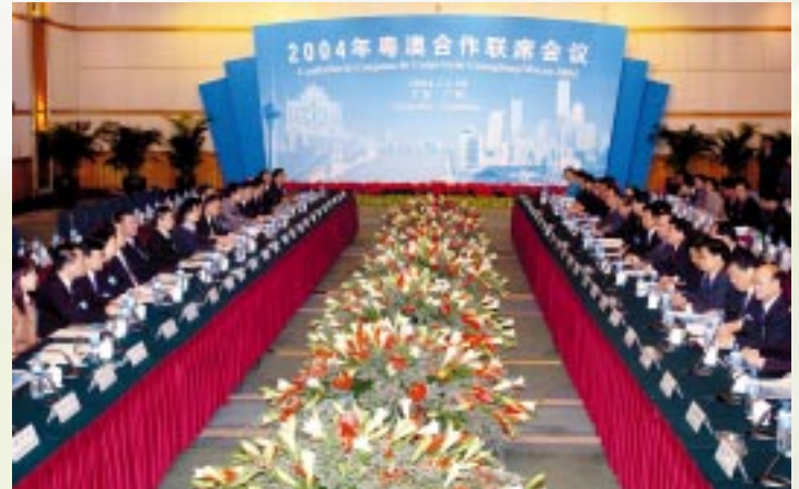
行政長官何厚鏞率領政府代表團出席粵澳合作聯席會議