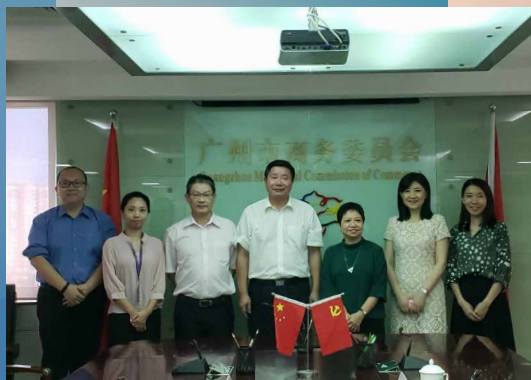
拜访广州市商务委员会

澳门特区政府于2018年6月19至29日组织澳门企业家代表团赴葡萄牙及巴西交流访问。其中，于6月21日在葡萄牙里斯本举行的“中国与葡语国家企业经贸合作洽谈会”上，澳中致远投资发展有限公司与葡萄牙著名孵化器Beta-i签署合作协议，将于里斯本设立“澳门互动区”，双方可互相推荐青创企业进驻对方的孵化中心，配合“中葡青年创新创业交流计划”的推出，可更精准支持澳门青年创业者前往葡萄牙创新创业。