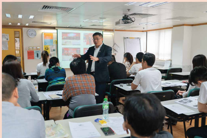
演讲嘉宾介绍最新跨境电商趋势

司，以精准的推广及营销策略拓展内地业务。是次活动起着推动澳门电子商贸发展的积极作用，既加深业界对跨境电商发展趋势的认识，亦协助澳门中小企开拓内地庞大市场。