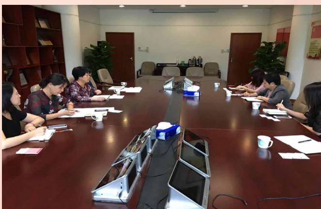
与深圳市经济贸易和信息化委员会进行会议

为落实并积极参与推动粤港澳大湾区建设的工作，加强经济局与大湾区内各地方商务主管部门的交流合作，经济局代表团于较早前走访粤港澳大湾区内地九市，与当地商务部门领导会面，并参观当地的澳资企业及高新产业园。