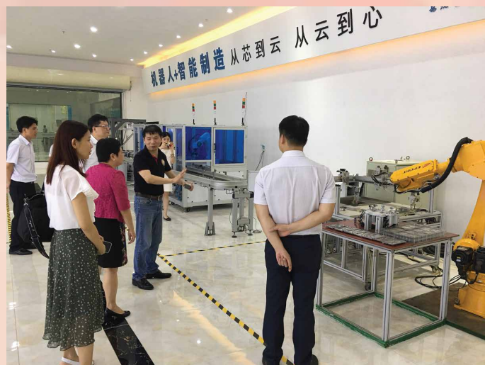
参观粤港澳大湾区城市科技产业

经济局期望通过访问大湾区九市的商务部门，并与其建立紧密的伙伴关系，进一步明确未来的合作方向。各方将本着优势互补、互利共赢的原则，深化区域合作，共同为粤港澳大湾区的经贸发展和建设作出贡献。