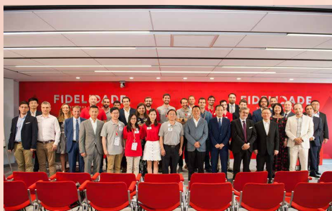
经济财政司司长参与了「复星Protecting全球青年创新创业大赛」结营礼

为落实发展澳门作为“中国与葡语国家商贸合作服务平台”，并继续推动“中葡青年创新创业交流中心”的建设工作，澳门特区政府于2018年6月19至29日组织澳门企业家代表团赴葡萄牙及巴西交流访问。其中，于6月21日在葡萄牙里斯本举行的“中国与葡语国家企业经贸合作洽谈会”上，澳中致远投资发展有限公司与葡萄牙著名孵化器Beta-i签署合作协议，将于里斯本设立“澳门互动区”，双方可互相推荐青创企业进驻对方的孵化中心，配合“