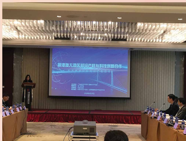
粤港澳大湾区知识产权与科技创新合作交流活动