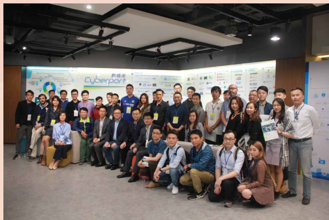
交流团以香港数码港作为交流行程的终点站

化模式、政策及产业发展趋势，令澳门初创人士对大湾区和澳门创业发展充满信心，期望透过各界共同努力及互相支持，推动青年创业的迅速发展，为澳门创新创业环境打造更有利条件。