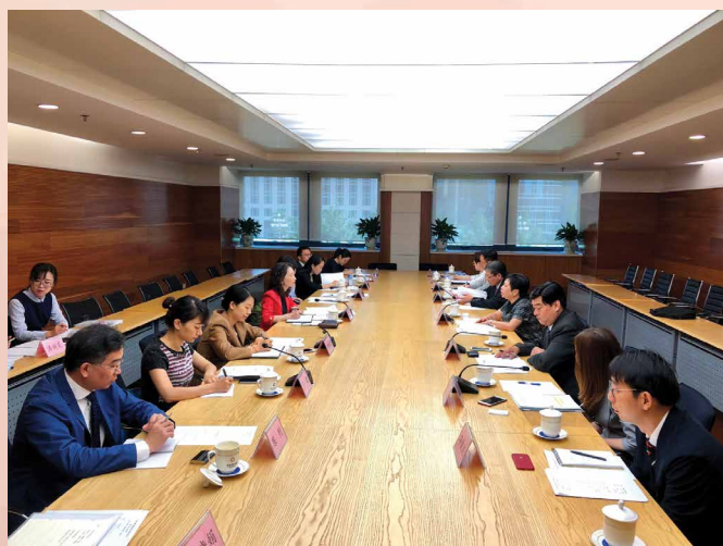
“CEPA货物贸易便利化专题小组会议”在北京举行

在通关便利化磋商方面，由经济局、澳门海关、澳门民政总署及澳门贸易投资促进局代表组成的澳门代表团于6月14日在北京与国家商务部、港澳办、海关总署及认监委等部门代表举行“CEPA货物贸易便利化专题小组会议”。双方在会上回顾了在共同努力下开展贸易便利化所取得的成果，此外，根据业界的实际所需，澳门方向内地各部委充分反映了对于通关便利化的各项诉求，双方就通关便利化、检验检疫及海关程序等议题交换意见，进行了充分沟通。