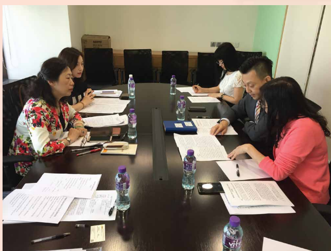
粤港澳大湾区知识产权推进工作会议

为进一步促进粤港澳大湾区知识产权领域的协作发展，加强湾区内的知识产权创造、运用和保护，2018年5月25日广东省知识产权局代表到访经济局，双方就建立粤港澳大湾区知识产权合作新机制、加强大湾区知识产权保护协作及完善知识产权信息资源共享平台等工作展开商讨和交流，借此合力打造粤港澳大湾区知识产权湾区，推动粤港澳大湾区整体创新发展。