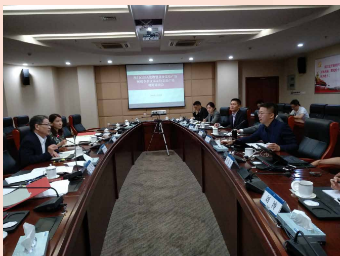
“澳门CEPA货物贸易协议原产地规则专项磋商会议”在重庆举行

3月20日CEPA货物贸易升级第一次高官会议在澳门举行，正式启动对《CEPA货物贸易协议》的磋商工作。在原产地标准磋商方面，内地海关总署与经济局于5月25日在重庆举行“澳门CEPA货物贸易协议原产地规则专项磋商会议”，就《CEPA货物贸易协议》涉及原产地规则章节的内容进行磋商，对完全获得或生产、区域价值成分、微小含量、累积规则及原产地核查等技术性问题进行了深入的沟通及探讨。