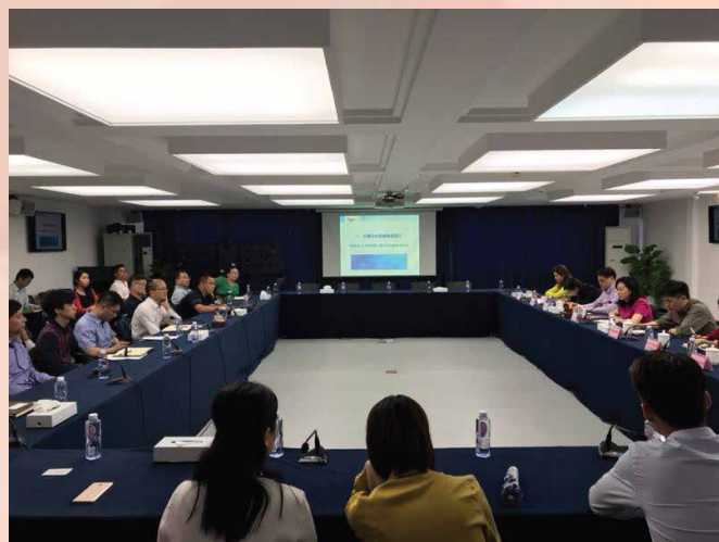
中葡合作发展基金推介会