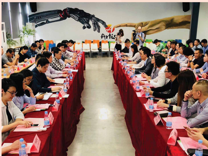
与中山市青创主管部门及当地初创企业进行交流座谈

为推动澳门青年融入粤港澳大湾区的建设和发展，由经济局主办、澳中致远投资发展有限公司协办的“粤港澳大湾区澳门青创交流团”于2018年4月12日至14日顺利举行，组织了42名澳门青年团体及青创企业代表共同参与。为期3天的参访活动，澳门青创交流团到访了粤港澳大湾区内5个城市的青创孵化基地，包括与澳门特区政府签署了青创合作协议的中山、广州、珠海及深圳，以及计划加强推进合作的香港数码港。