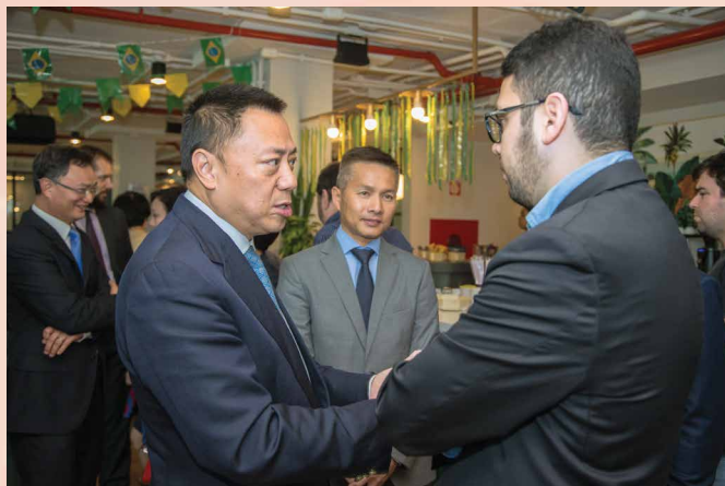
经济财政司司长参观了里约热内卢的青创企业中心Fábrica de Startups，并与四个青创项目的负责人交流

葡萄牙行程结束后，经济财政司司长率领澳门企业家代表团转赴巴西继续行程。6月26日下午，代表团一行参观了里约热内卢的青创企业中心Fábrica de Startups，并与四个青创项目的负责人交流。经济财政司司长及代表团一行于6月28日正式结束葡萄牙和巴西的考察访问行程，启程返回本澳。（资料来源：澳门经济财政司及澳门青年创业孵化中心）