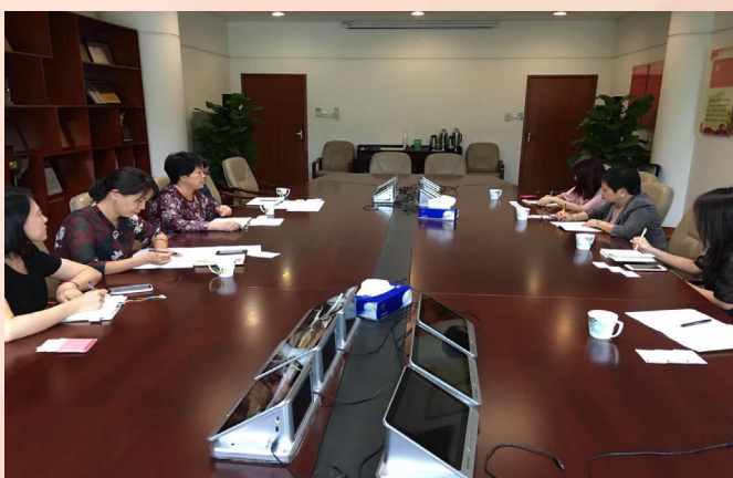
與深圳市經濟貿易和信息化委員會進行會議

為落實並積極參與推動粵港澳大灣區建設的工作，加強經濟局與大灣區內各地方商務主管部門的交流合作，經濟局代表團於較早前走訪粵港澳大灣區內地九市，與當地商務部門領導會面，並參觀當地的澳資企業及高新產業園。