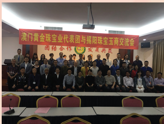
兩地業界交流座談

揭陽市享有“中國玉都”的美譽，以其加工設施以及工藝技術著名，是集合翡翠、玉器加工及貿易於一體的專業化工業區。澳門的黃金珠寶業是本地零售服務業的基石，行業的銷售額一直穩佔澳門總零售額超過兩成，是澳門經濟發展重要的一環。