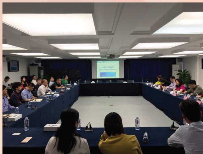
中葡合作發展基金推介會