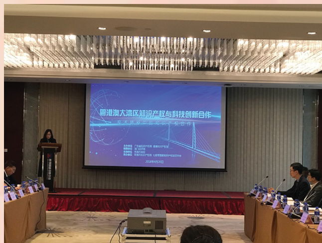
粵港澳大灣區知識產權與科技創新合作交流活動