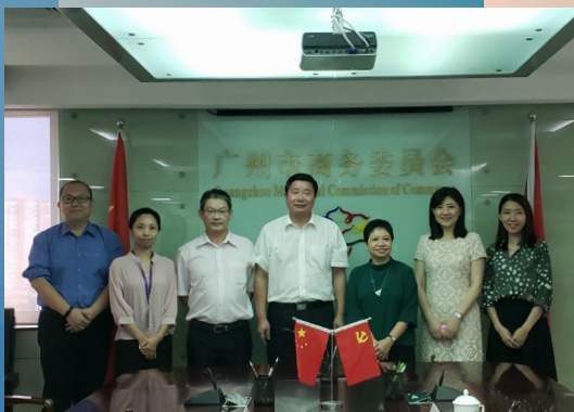
拜訪廣州市商務委員會

澳門特區政府於2018年6月19至29日組織澳門企業家代表團赴葡萄牙及巴西交流訪問。其中，於6月21日在葡萄牙里斯本舉行的“中國與葡語國家企業經貿合作洽談會”上，澳中致遠投資發展有限公司與葡萄牙著名孵化器Beta-i簽署合作協議，將於里斯本設立“澳門互動區”，雙方可互相推薦青創企業進駐對方的孵化中心，配合“中葡青年創新創業交流計劃”的推出，可更精準支持澳門青年創業者前往葡萄牙創新創業。