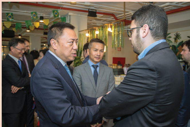
經濟財政司司長參觀了里約熱內盧的青創企業中心Fábrica de Startups，並與四個青創項目的負責人交流

葡萄牙行程結束後，經濟財政司司長率領澳門企業家代表團轉赴巴西繼續行程。6月26日下午，代表團一行參觀了里約熱內盧的青創企業中心Fábrica de Startups，並與四個青創項目的負責人交流。經濟財政司司長及代表團一行於6月28日正式結束葡萄牙和巴西的考察訪問行程，啟程返回本澳。(資料來源：澳門經濟財政司及澳門青年創業孵化中心)