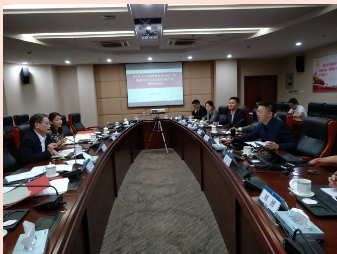
“澳門CEPA貨物貿易協議原產地規則專項磋商會議”在重慶舉行

3月20日CEPA貨物貿易升級第一次高官會議在澳門舉行，正式啟動對《CEPA貨物貿易協議》的磋商工作。在原產地標準磋商方面，內地海關總署與經濟局於5月25日在重慶舉行“澳門CEPA貨物貿易協議原產地規則專項磋商會議”，就《CEPA貨物貿易協議》涉及原產地規則章節的內容進行磋商，對完全獲得或生產、區域價值成分、微小含量、累積規則及原產地核查等技術性問題進行了深入的溝通及探討。