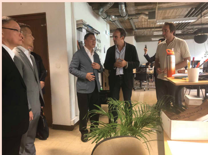
澳門企業家代表團參觀Beta-i並與當地青創人士交流

“中葡青年創新創業交流計劃”的推出，可更精準支持澳門青年創業者前往葡萄牙創新創業。“洽談會”期間，經濟財政司司長帶領代表團參觀Beta-i，並參與了「復星Protechtig全球青年創業創新大賽」挑戰營的結營禮，為正在里斯本參與挑戰營的兩隊澳門隊伍打氣，並見證了兩團隊進入大賽最後十二強。