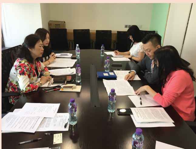
粵港澳大灣區知識產權推進工作會議

為進一步促進粵港澳大灣區知識產權領域的協作發展，加強灣區內的知識產權創造、運用和保護，2018年5月25日廣東省知識產權局代表到訪經濟局，雙方就建立粵港澳大灣區知識產權合作新機制、加強大灣區知識產權保護協作及完善知識產權信息資源共享平台等工作展開商討和交流，藉此合力打造粵港澳大灣區知識產權灣區，推動粵港澳大灣區整體創新發展。