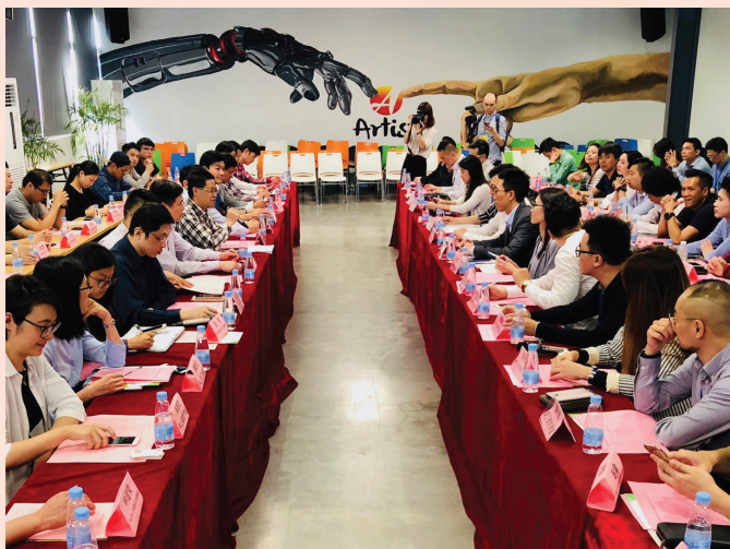
與中山市青創主管部門及當地初創企業進行交流座談

為推動澳門青年融入粵港澳大灣區的建設和發展，由經濟局主辦、澳中致遠投資發展有限公司協辦的“粵港澳大灣區澳門青創交流團”於2018年4月12日至14日順利舉行，組織了42名澳門青年團體及青創企業代表共同參與。為期3天的參訪活動，澳門青創交流團到訪了粵港澳大灣區內5個城市的青創孵化基地，包括與澳門特區政府簽署了青創合作協議的中山、廣州、珠海及深圳，以及計劃加強推進合作的香港數碼港。