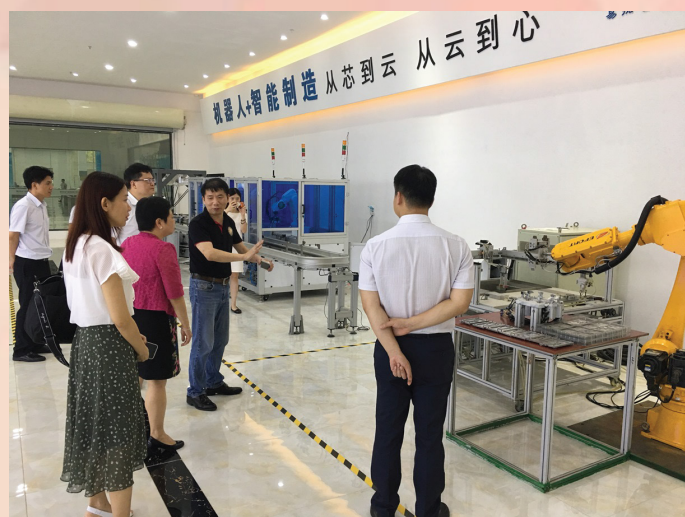
參觀粵港澳大灣區城市科技產業

經濟局期望通過訪問大灣區九市的商務部門，並與其建立緊密的伙伴關係，進一步明確未來的合作方向。各方將本着優勢互補、互利共贏的原則，深化區域合作，共同為粵港澳大灣區的經貿發展和建設作出貢獻。