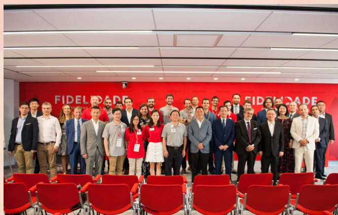
經濟財政司司長參與了「復星Protecting全球青年創業創新大賽」結營禮

為落實發展澳門作為“中國與葡語國家商貿合作服務平台”，並繼續推動“中葡青年創新創業交流中心”的建設工作，澳門特區政府於2018年6月19至29日組織澳門企業家代表團赴葡萄牙及巴西交流訪問。其中，於6月21日在葡萄牙里斯本舉行的“中國與葡語國家企業經貿合作洽談會”上，澳中致遠投資發展有限公司與葡萄牙著名孵化器Beta-i簽署合作協議，將於里斯本設立“澳門互動區”，雙方可互相推薦青創企業進駐對方的孵化中心，配合