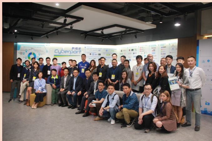
交流團以香港數碼港作為交流行程的終點站

化模式、政策及產業發展趨勢，令澳門初創人士對大灣區和澳門創業發展充滿信心，期望透過各界共同努力及互相支持，推動青年創業的迅速發展，為澳門創新創業環境打造更有利條件。