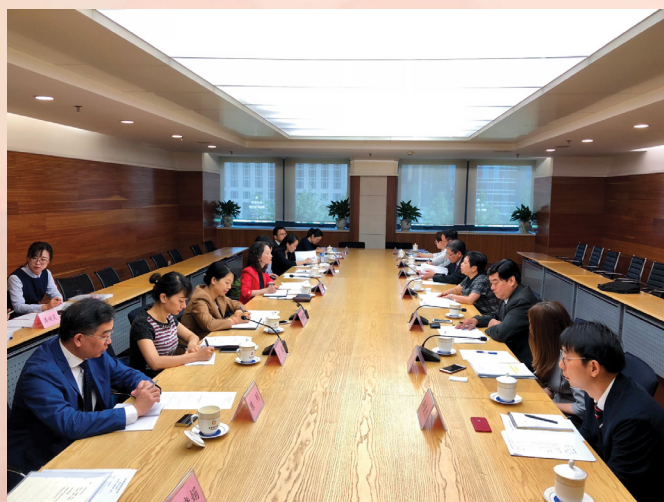
“CEPA貨物貿易便利化專題小組會議”在北京舉行

在通關便利化磋商方面，由經濟局、澳門海關、澳門民政總署及澳門貿易投資促進局代表組成的澳門代表團於6月14日在北京與國家商務部、港澳辦、海關總署及認監委等部門代表舉行“CEPA貨物貿易便利化專題小組會議”。雙方在會上回顧了在共同努力下開展貿易便利化所取得的成果，此外，根據業界的實際所需，澳門方向內地各部委充分反映了對於通關便利化的各項訴求，雙方就通關便利化、檢驗檢疫及海關程序等議題交換意見，進行了充分溝通。