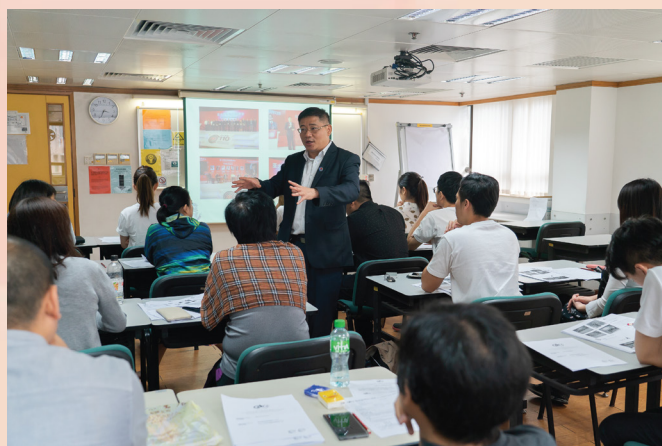
演講嘉賓介紹最新跨境電商趨勢

司，以精準的推廣及營銷策略拓展內地業務。是次活動起着推動澳門電子商貿發展的積極作用，既加深業界對跨境電商發展趨勢的認識，亦協助澳門中小企開拓內地龐大市場。